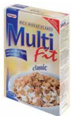
→ Brüggen produit 100 000 tonnes de céréales dans ses 3 sites européens.

La société d'origine allemande H & J Brüggen a confirmé début décembre 2005 l'ouverture d'une unité de production de céréales pour petits déjeuners à Thiers en Auvergne (Puy-de-Dôme). Ce projet avait été détecté et conseillé depuis mi 2002 par Sofred dans le cadre d'une mission de prospection pour l'Agence Régionale de Développement d'Auvergne. L'accompagnement du projet vient donc d'aboutir avec succès.