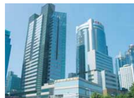
→ Le dynamisme chinois, source de nouveaux partenariats.

Par ailleurs, ce premier contact a permis l'identification d'un réseau de consultants spécialisés dans les échanges avec la Chine, visant à mener une veille et une prospection actives sur ce pays. Un projet de relocalisation de Chine en France d'assemblage de deux-roues, issu de ce réseau, vient également d'être identifié. Un second voyage de rencontres est prévu mi 2006. ■