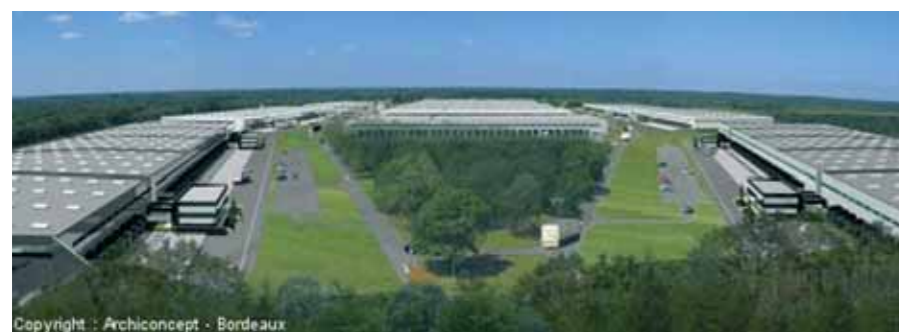
→ Maquette de la future plate-forme logistique SEVESO II à Salbris.

Les évolutions des normes européennes en matière de sécurité industrielle et d'environnement contraignent les logisticiens à mettre en place des outils d'exploitation toujours plus sophistiqués. Les zones susceptibles d'accueillir des entrepôts classés existent, mais l'offre reste en définitive rare et les besoins souvent non satisfaits. Pourtant certains territoires parviennent à créer un « produit » ad hoc et à exploiter leurs atouts territoriaux au profit du développement économique... mais les « élus » sont peu nombreux.