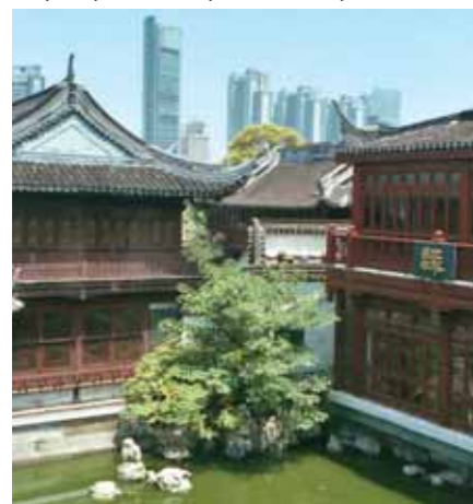
→ Shanghai, reflet du contraste chinois.

S'inscrivant comme partenaire de l'opération, Sofred avait un double objectif : contribuer à la détection et à l'implantation de projets d'origine chinoise sur le territoire du Loir & Cher et préparer de futures actions de prospection auprès d'entreprises